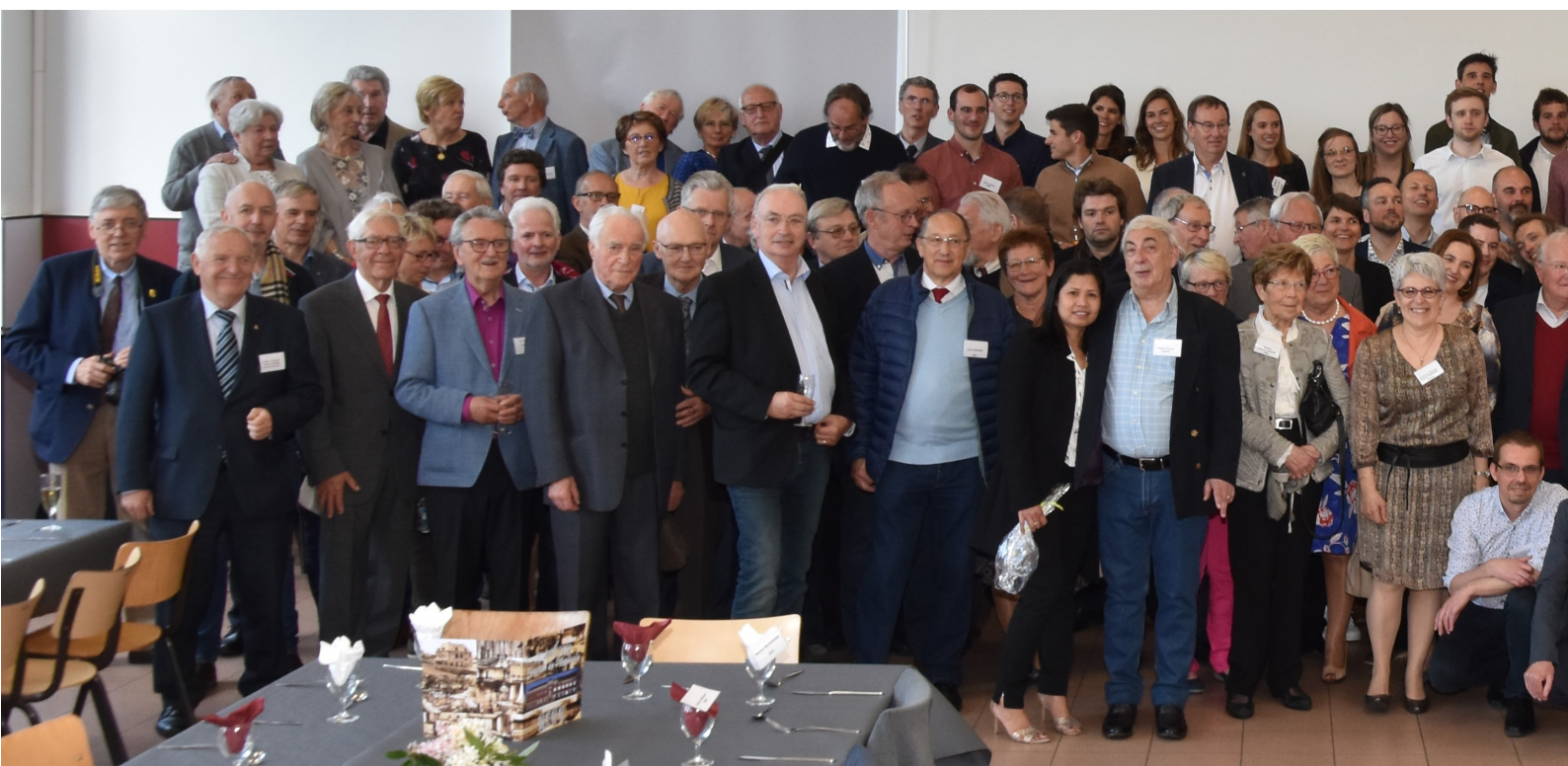
La grande photo traditionnelle de la fête de l'amicale.