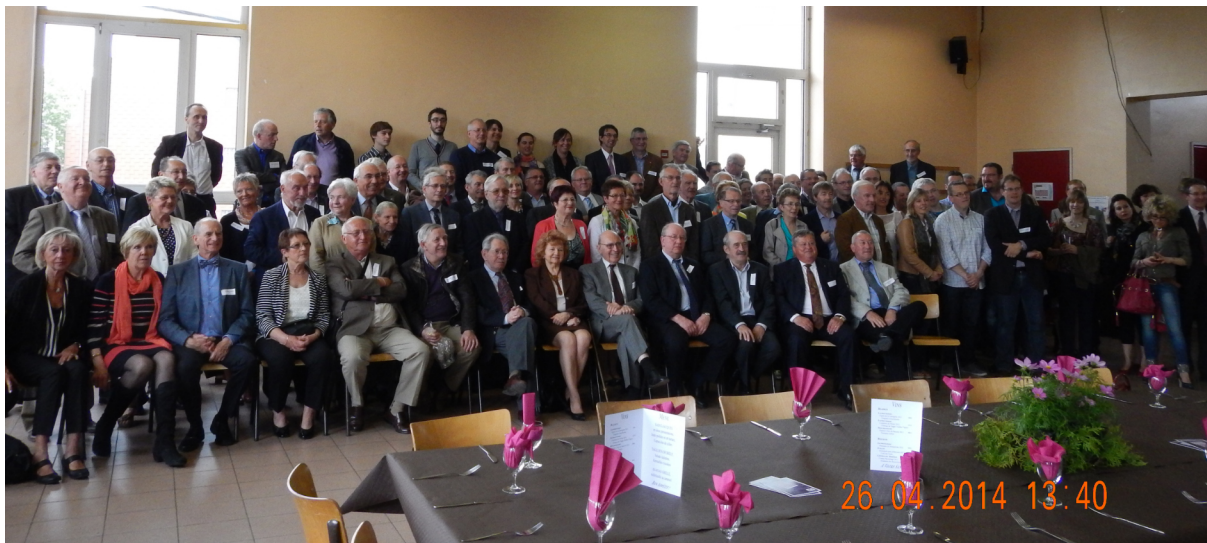
La fête de l'Amicale en 2014

Aidez-nous en envoyant les adresses postales et/ou électroniques des anciens des années 1999 et 2014 que vous connaissez à wordpress@amicaledesanciensdesainthadelin.be .